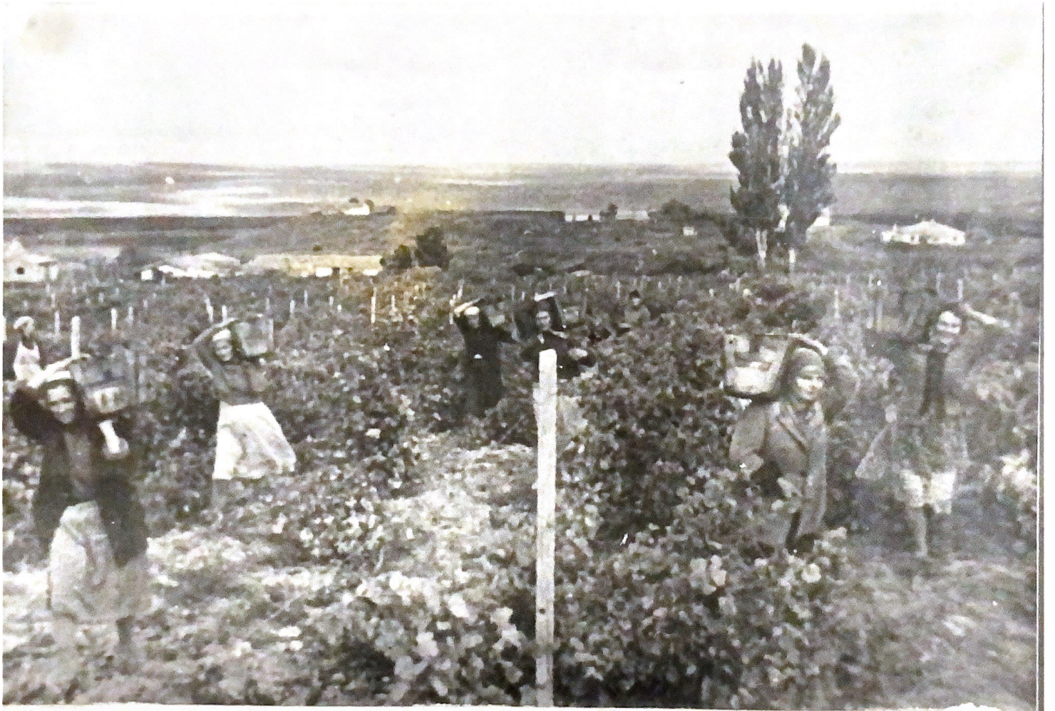
УБОРКА ВИНОГРАДА В СОВХОЗЕ 1950 ГОДЫ