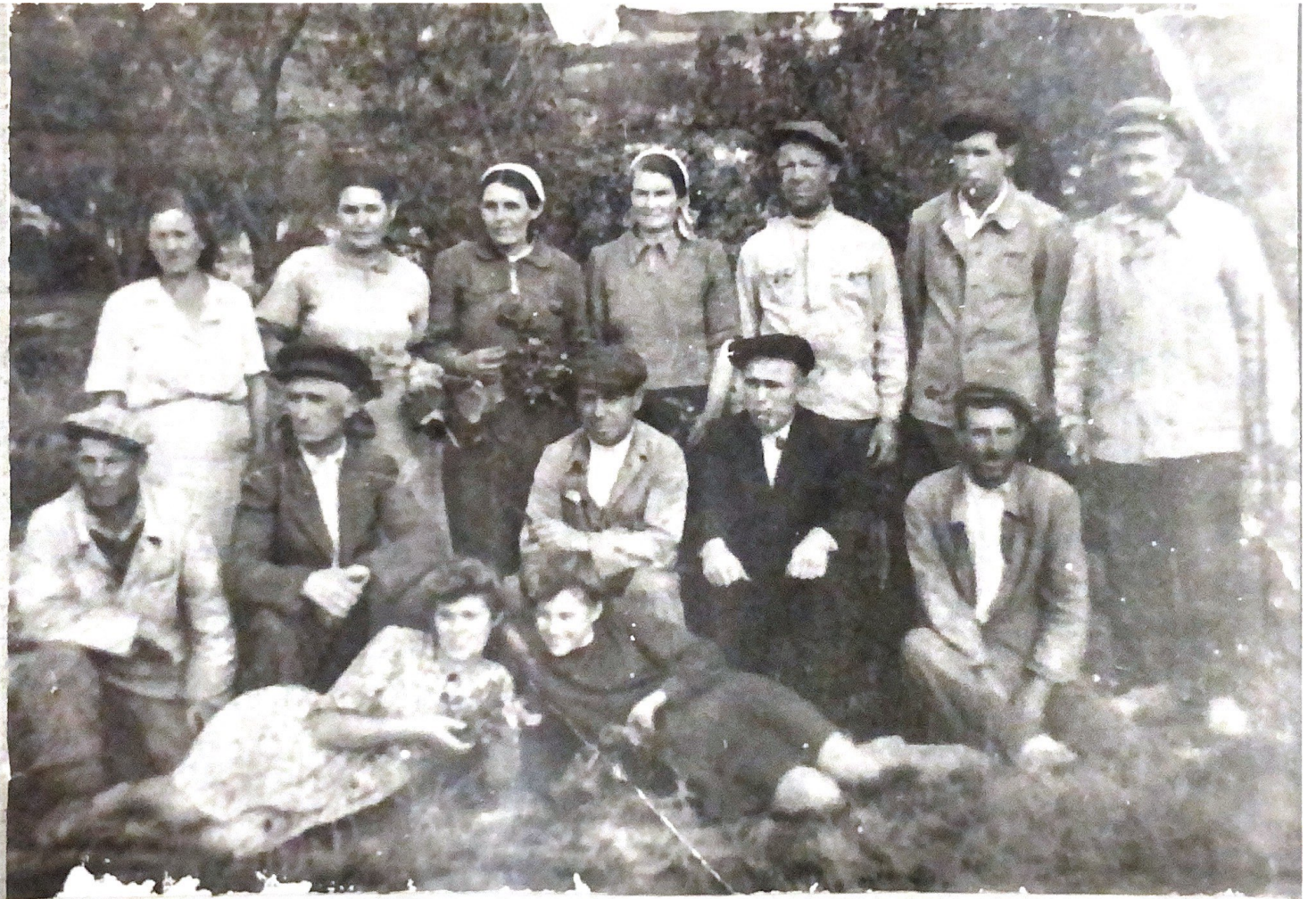
РАБОЧИЕ ОТДЕЛЕНИЯ №4 совхоза «ФЕОДОСИЙСКИЙ» 1949 ГОД