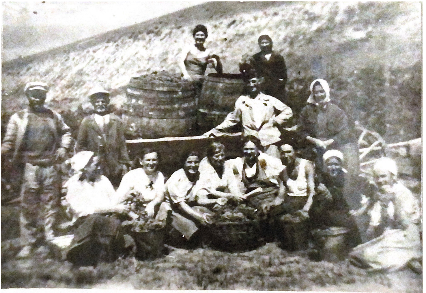
УБОРКА ВИНОГРАДА В СОВХОЗЕ «КРАСНЫЙ ПЛАНЕР» 1945 ГОД.