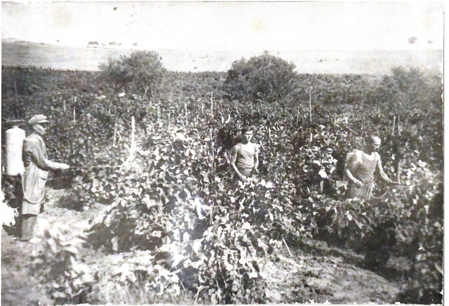
ОПРЫСКИВАНИЕ ВИНОГРАДНИКОВ В СОВХОЗЕ