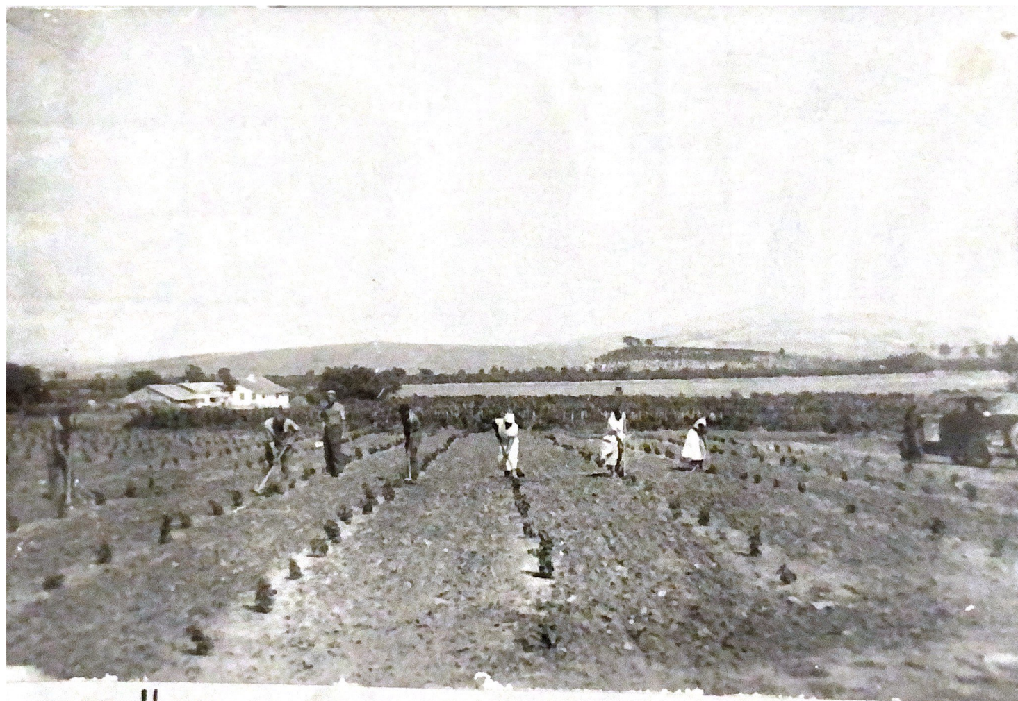
ЦАПОВКА МОЛОДЫХ ВИНОГРАДНИКОВ В СОВХОЗЕ «ФЕОДОСИЙСКИЙ» 50 ЫЕ ГОДЫ